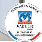
PROTECTIONOME VERRE - Ref. 8222